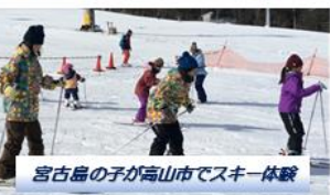
宮古島の子が高山市でスキー体験