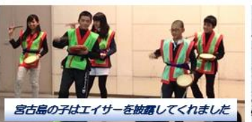
宮古島の子はエイサーを披露してくれました