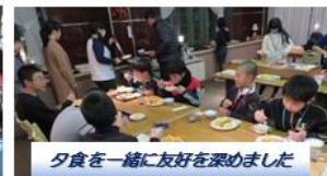
夕食を一緒に友好を深めました