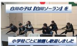
白川の子は『白川ソラン』を