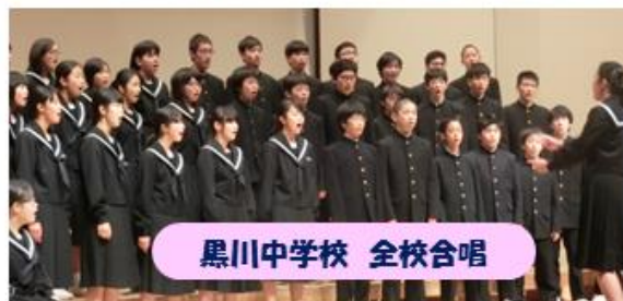
黒川中学校 全校合唱

11月8日(水)に加茂郡中学校音楽会が、11月21日(火)に白川町小学校音楽会が町民会館グロリアホールで行われました。加茂郡中学校音楽会では、郡内10校が合唱を披露しました。他の学校と比べ、決して人数は多くはありませんが、曲想を考え、表現豊かに歌う姿から、聞く人の心に届く合唱を披露しました。小学校音楽会では、5校の3・4年生が合唱と合奏を発表し、高音が綺麗な歌声と、一生懸命練習した姿が浮かぶ合奏でした。