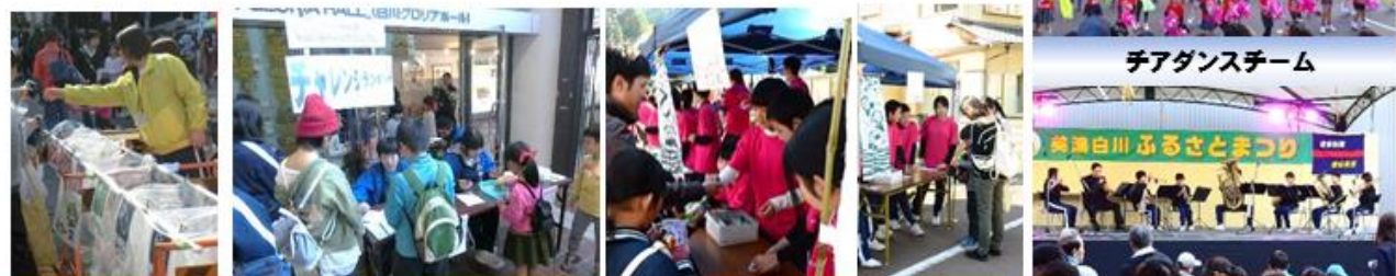
中学生のボランティア (会場案内・ゴミ拾い等) ジュニアリーダーズクラブ (チャレンジランキング) 白中起業家学習で白中特製『てぬくい』を販売 (2年生) 吹奏楽部発表 (白川中学校吹奏楽部)

毎年子どもたちが楽しみにしているこの祭り。その中で、活躍する子どもたちがいます。もちろんステージが上がって活躍する子どももいれば、祭りを陰で支え活躍する子どももいます。幼児を楽しませようと、幼児目線で優しい声をかけ、必死に楽しませようとするジュニアリーダーズの中学生。会場には、たくさんのゴミが落ちていましたが、人混みをかき分けながらゴミを拾うボランティアの中学生。そんな姿を見ていると、温かな気持ちになります。きっと素敵な大人になっていくことでしょう。