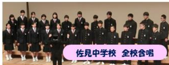
佐見中学校 全校合唱

11月8日(水)に加茂郡中学校音楽会が、11月21日(火)に白川町小学校音楽会が町民会館グロリアホールで行われました。加茂郡中学校音楽会では、郡内10校が合唱を披露しました。他の学校と比べ、決して人数は多くはありませんが、曲想を考え、表現豊かに歌う姿から、聞く人の心に届く合唱を披露しました。小学校音楽会では、5校の3・4年生が合唱と合奏を発表し、高音が綺麗な歌声と、一生懸命練習した姿が浮かぶ合奏でした。