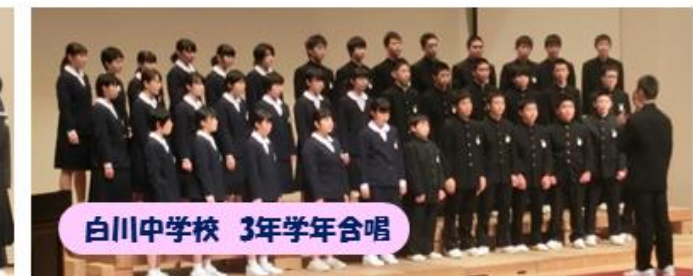
白川中学校 3年学年合唱